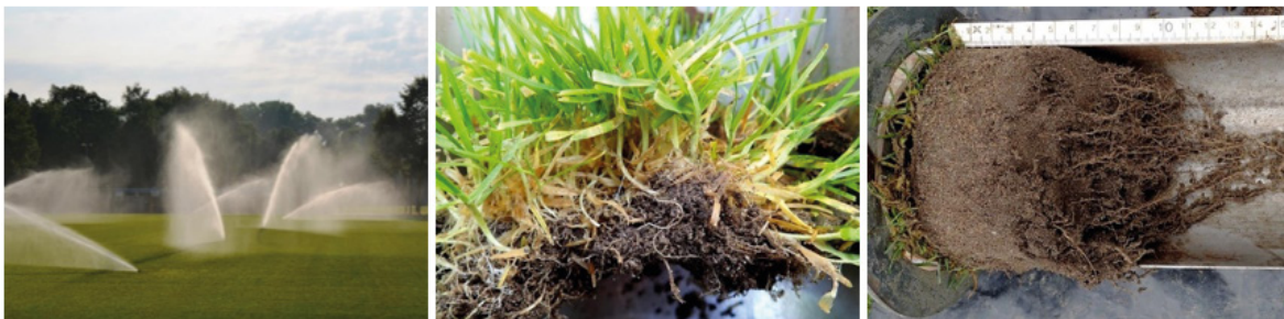
Figuur 3: Te vaak beregenen leidt tot een dichte, zwakke grasmat met veel straatgras, vilt en oppervlakkige wortels. Diep wortelende sportveldgrassen maken de grasmat robuuster

Begin met beregenen als het onderste 1/3-deel van de wortelzone nog net vochtig aanvoelt. Maak ter controle een steek met een spa of een guts tot minimaal 20 centimeter diep. Geef per keer zoveel water dat de grond tot iets onder de wortelzone goed vochtig is. Meer is verspilling. Alleen pas ingezaaid gras moet in droge perioden vaak dagelijks worden beregenend. Zodra de grasgroei doorzet, is het zaak om de beregeningsfrequentie af te bouwen.