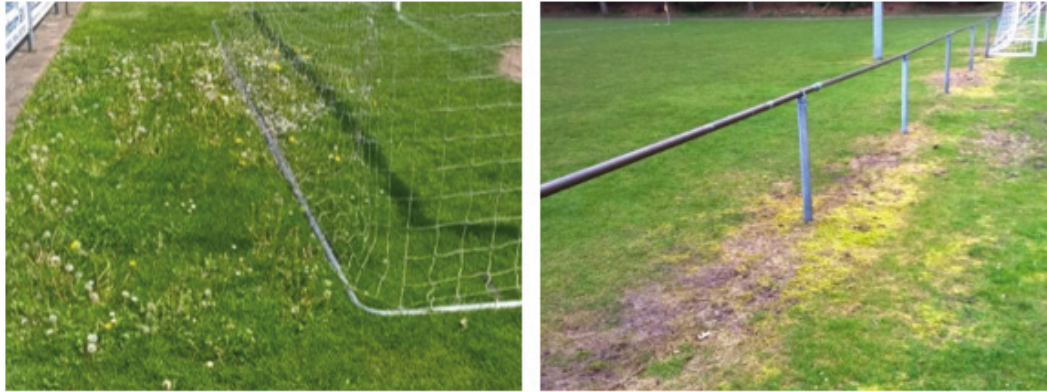
Figuur 2: Onderbespeling en scalperen van de grasmat zijn belangrijke oorzaken van onkruidgroei

Een motormaaier heeft voorkeur boven een bosmaaier, omdat de maaihoogte beter is te reguleren. Frequenter maaien van goed groeiend gras geeft een dichtere zode. Schrale stroken met veel mos kunnen in het voorjaar het best licht bemest worden.