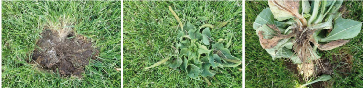
Figuur 4: Onkruiden verdringen het gras. Het is verstandig ze uit te steken voor de bloei om uitzaaien tegen te gaan

Het is belangrijk om te signaleren wanneer bepaalde onkruiden toenemen en wanneer er sprake is van schade door ziekten of plagen. Preventie en bestrijding van ziekten en plagen is vooral een taak voor de professionele beheerders. Vrijwilligers mogen op sportvelden geen pesticiden gebruiken. Incidentele onkruiden kunnen het beste handmatig voor de bloei worden uitgestoken.